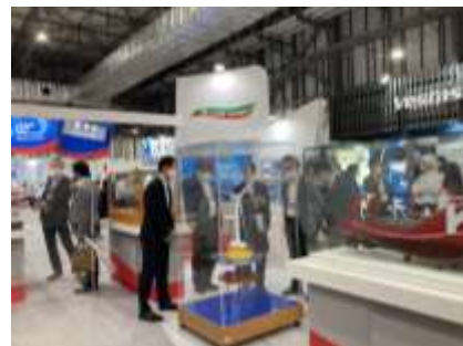
【川崎汽船グループの洋上風力関連事業取り組み紹介動画】