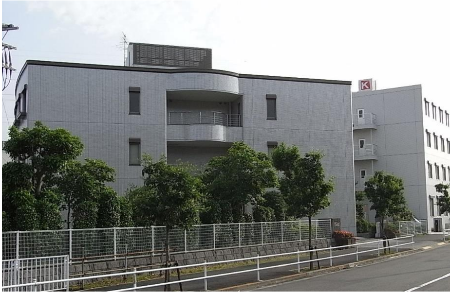
川崎汽船研修所（"K" Line Maritime Academy (Japan)）