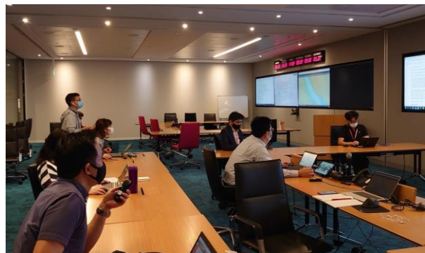
ONE 本社での対応の様子（シンガポール）