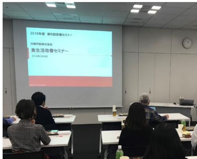
食生活改善セミナーの様子