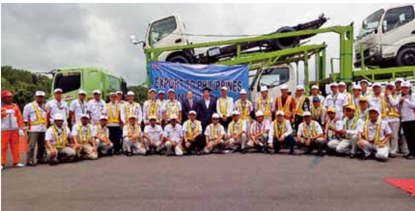
トラックキャリアに携わる関係者 Members participated in the project