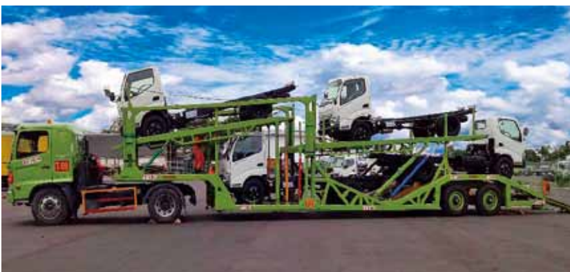
小型トラック 4 台を一度に運搬できる トラックキャリア The truck carrier which enables transporting four new trucks at one time