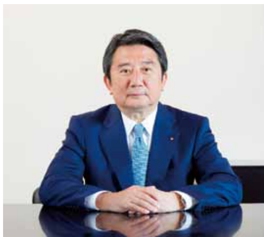
川崎汽船株式会社 代表取締役社長