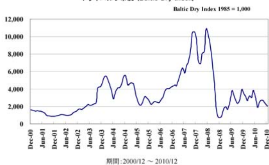
ドライバルク市況 (Baltic Dry Index)